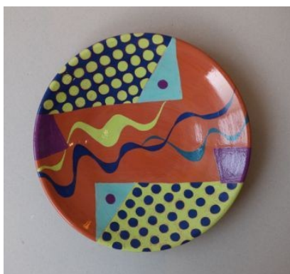
Ospa andaluzyjska, 2009

Dwanaście talerzy ceramicznych stworzonych w czasie pobytu w Toskanii zostało zaprezentowanych na wystawie poplenerowej „Pejzaż Południa” w krakowskiej galerii ZPAP Pryzmat (2005). Z kolei w andaluzyjskim miasteczku Gaucín powstały oprócz talerzy (pogrupowanych w cykle „Ryby i fale”, „Ryby geometryczne”, „Wypukłe wklęsłe”), także wazony czy rzeźby ( Anioł Andaluzyjski ). Mogli je obejrzeć zwiedzający wystawę „Andaluzja 1280°C” w Galerii aTAK w Warszawie (2010).