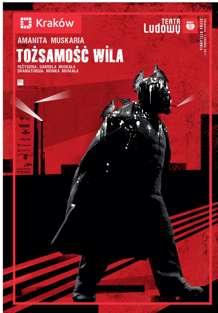
Plakat do spektaklu Tożsamość Wila , autor: Ryszard Kaja, Teatr Ludowy (2017)

Kultowe budynki zostają poddane antropomorfizacji i na spotkaniu klasowym ucinają sobie pogawędkę o czasach młodości. W spektaklu pojawiają się także postacie dwóch antropologów, które pomagali budować studenci UJ. Czarek jest typem showmana, a Damian cierpi na... fobię społeczną, co nie ułatwia mu badań terenowych, szczególnie rozmów z ludźmi i poznawania nowych miejsc.